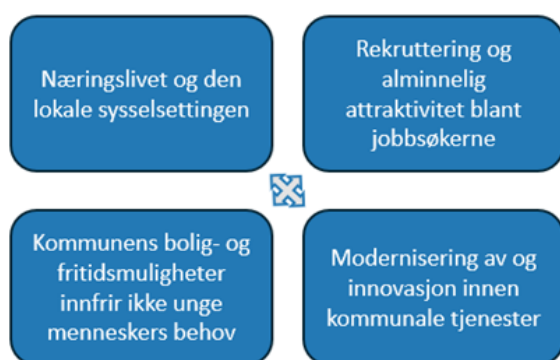
Figur 1: Fra kommuneplanens samfunnsdel 2021-2032.

Utfordringsbildet for etat for NUT er delt. De demografiske utfordringene krever en tilpasning av boligtilbudet. Etaten har også ansvaret for vedlikehold av kommunal infrastruktur og boligmasse. Effektene av klimaendringene er utfordrende, og etaten må derfor tilegne seg økt kompetanse for å imøtekomme disse endringene.