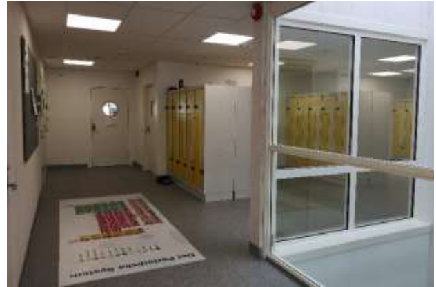
Bilder fra nyskolen – luftig og moderne.

Fagnettverk. Kvæningen kommune har sammen med de andre Nord-Tromskommunene etablert fagnettverk for flere faggrupper. Dette dreier seg om matematikk og norsk.