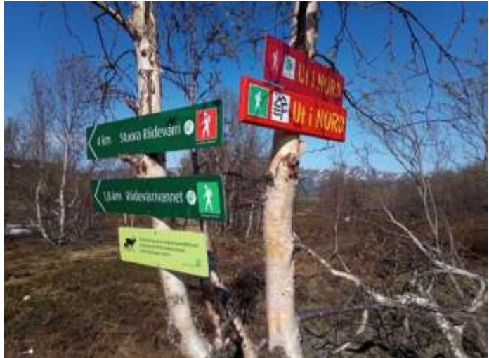
Trimprogrammet ut i Nord får mange Nord-Tromsinger ut på tur.

*Valdene på Alteidet sluttet seg til Storvaldet «Alteidet-Langfjorden» som forvaltes av Alta kommune i 2015. Kvænangen sin «andel» av uttaket i valdet er inkludert i disse tallene.