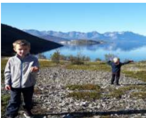
På tur ved Kviteberg en fin sommerdag 2019

Gjennom denne ordningen har vi hatt tilsatt miljøterapeut i 100% stilling ved skolen siden