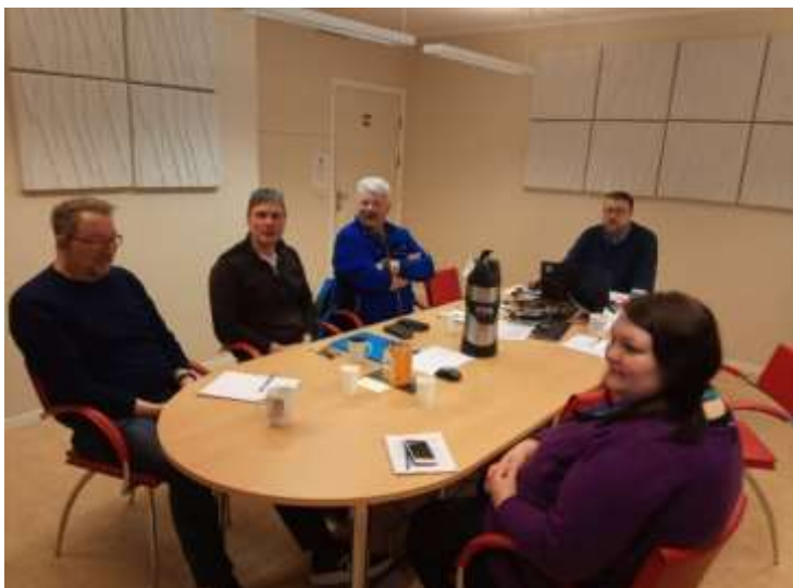
Avdelingsmøte i NUT.

NUT har et godt arbeidsmiljø, med motiverte og godt kvalifiserte medarbeidere, i hele etaten.