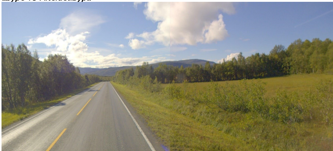
Figur 3: Krysningpunkt EV6 S198D1 m8675 er sikt ivaretatt, men krysningpunkt må uformes iht. veileder for snøscooter.