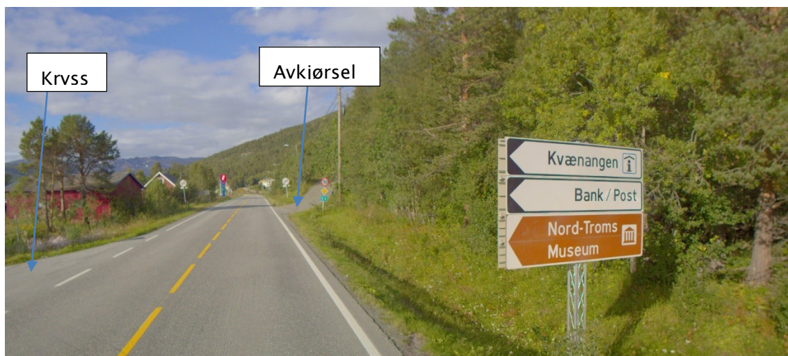
Figur 2. Krysningpunkt er mellom kryss og avkjørsel EV6 S198D1 m118