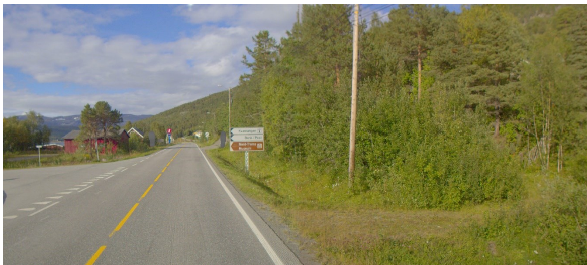
Figur 1. Stort skilt som kan være sikthinder. Det må kontrolleres at planet mellom øye punkt i sekundærvegen (scooterløypa) og kjørebane i primærvegen (riksveg), er fritt for sikthindringer.

Det er ikke så mange andre alternativer på krysningspunkt til bensinstasjonen. Men det vil kreve tiltak som hugging av trær for å utbedre sikt og oppfylling av rampe iht. krav på utforming av krysningspunkt på E6. Snøscooterløypen vil være parallelt med veg. Det er eneste mulighet for å få anlagt en snøscooterløype, og man må være oppmerksom på under dårlige værforhold og i mørke kan vegen og snøscooterløypen, hvis de ligger for nært hverandre, gå i ett. Dette vil kunne forvirre førere både på vegen og i snøscooterløypen. Lysene på kjøretøyene og refleksene på løypemerkingen kan føre til misforståelse, som igjen kan føre til utforkjøringer eller påkjørsler. For myke trafikanter vil det kunne oppleves som farefullt å bevege seg mellom to ulike systemer for motorisert ferdsel. I tillegg kan parallelle systemer føre til problemer for effektiv vinterdrift på vegen. Ber om at dere vurderer disse forhold og innarbeidet det i deres forslag på krysningspunkt. I tillegg må dere må vurdere om skilt i kryss er sikthinder se bilde under.