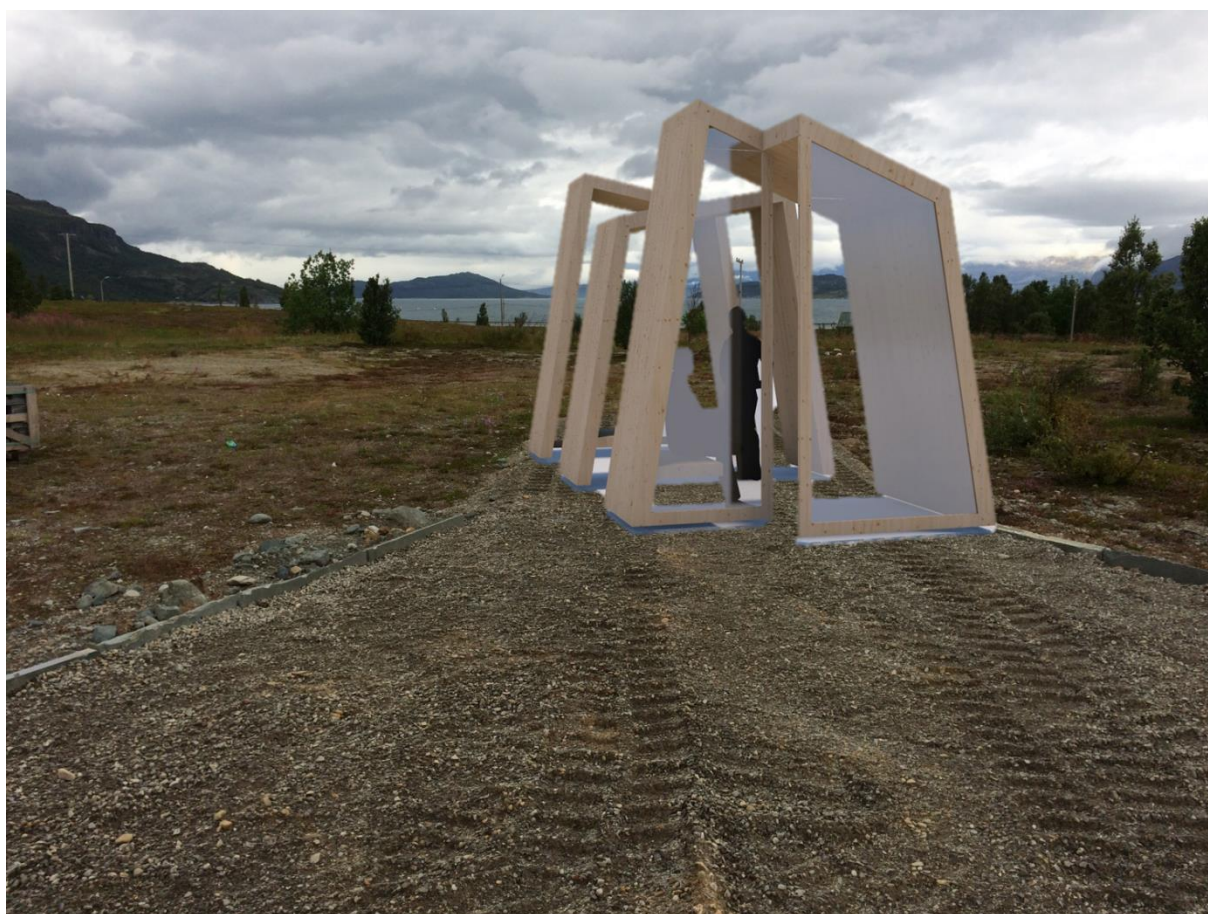
Figur 2 – Illustrasjon-bildemontasje av informasjonspaviljongen sett mot nord