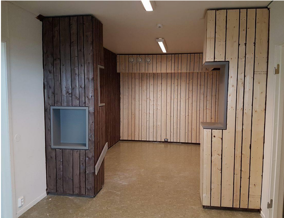
Bilde over: Viser status for arbeidet med informasjonsrommet.