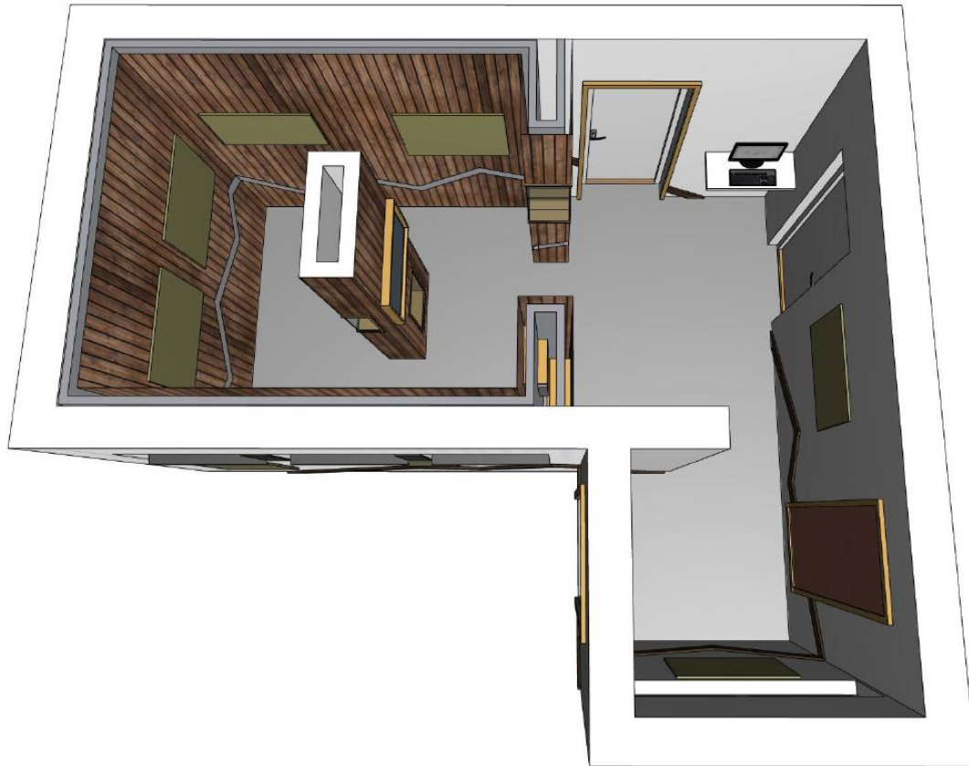
Figur 1 Perspektivskisse for informasjonsrommet

Tanken med informasjonsrommet har vært å ha en liten utstilling eller «mikro-museum» for formidling av informasjon med bruk av bilder, plakater, digitale verktøy og gjenstander. Det er også tilknyttet sanitærfasiliteter. Det er gjennomført et prosjekt for organisering av samarbeid, planlegging og bygging av informasjonsrommet. Prosjektet er avsluttet i mars 2017, men det gjenstår noe arbeid før anlegget er ferdig til bruk.