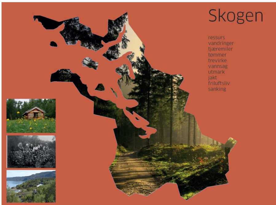
Til venstre. Eksempel på plakatdesign. Under arbeid.