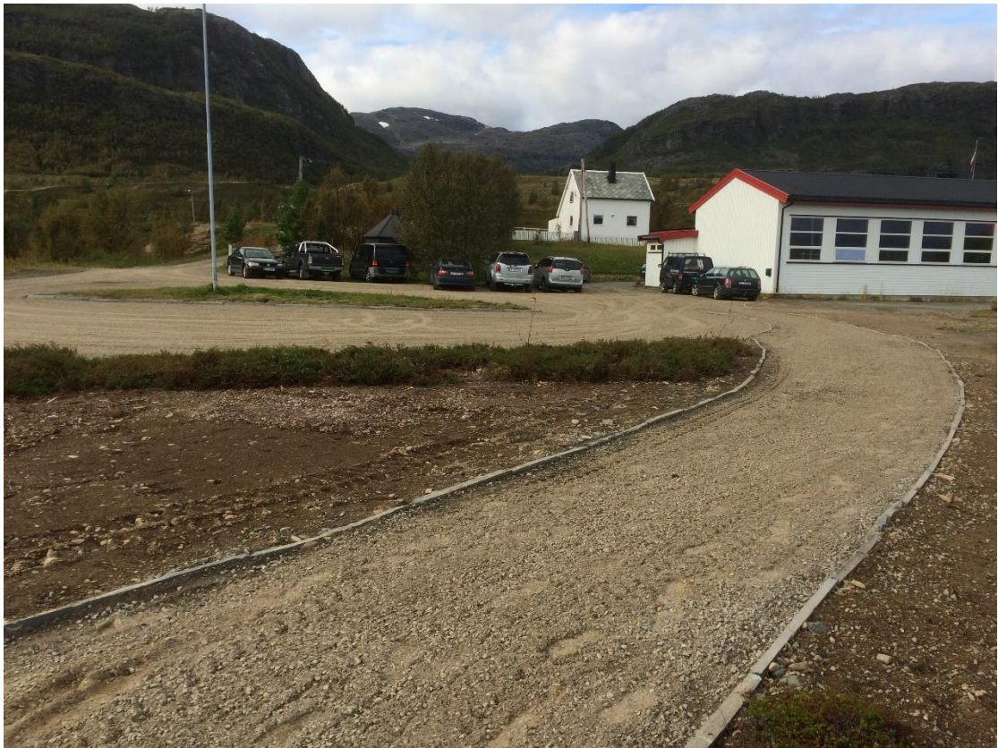
Bilde over: Viser pareringsanlegget sett mot Kvæningshagen Verdde Bilde under: grunnarbeid ved rasteplassen. Utsikt mot sør.